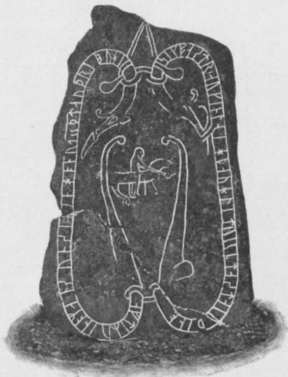
Fig. 1. Vidbostenen.

L. 605 bör sålunda sannolikt läsas: airikr + aukhakun +