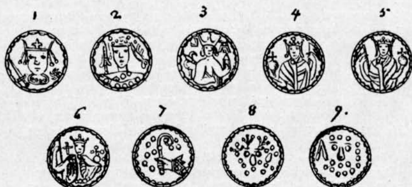
Fig. 140. Mynttyper ur fynd I.

1. H. 1 550, vars teckning dock ger ett alltför grovt intryck. Ant. 2 101 \frac{1}{2} . Bruun 85. 3 — 2. Th. fig. 88: 12; jfr H. 551. — 3. H. 541, Th. fig. 88: 1. — 4. H. 543, Ant. 95, Th. fig. 88: 2. — 5. Någon dylik typ är ej förut beskriven. En liknande ur K. Myntkabinetets samling avbildas här (fig. 141). De Bromellska teckningarnas allmänna tillförlitlighet tillåter slutsatsen, att det Bromellska exemplaret utgjort en urtyp till denna något degenererade typ. — 6. Torde med all säkerhet vara identisk med H. 546, Ant. 99 och Th. fig. 88: 5. Bromell har uppfattat den yttre delen av svärdet som en underarm och den inre som en lans. — 7. Th. fig. 88: 17. Jfr H. 554. — 8. Th. fig. 88: 10. Jfr d:o 11 och Ant. 93. — 9. Th. fig. 88: 14. Jfr H. 552, Ant. 102.