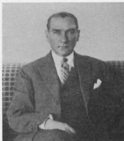
Fig. 5. Kemal Atatürk, turkiska republikens president.