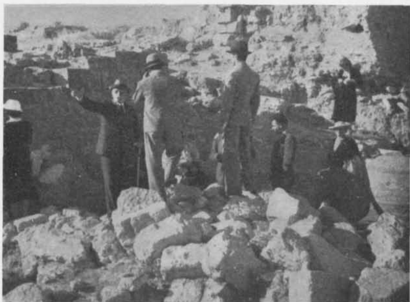
Fig. 7. Prof. W. Dörpfeld visar Trojas ruiner.