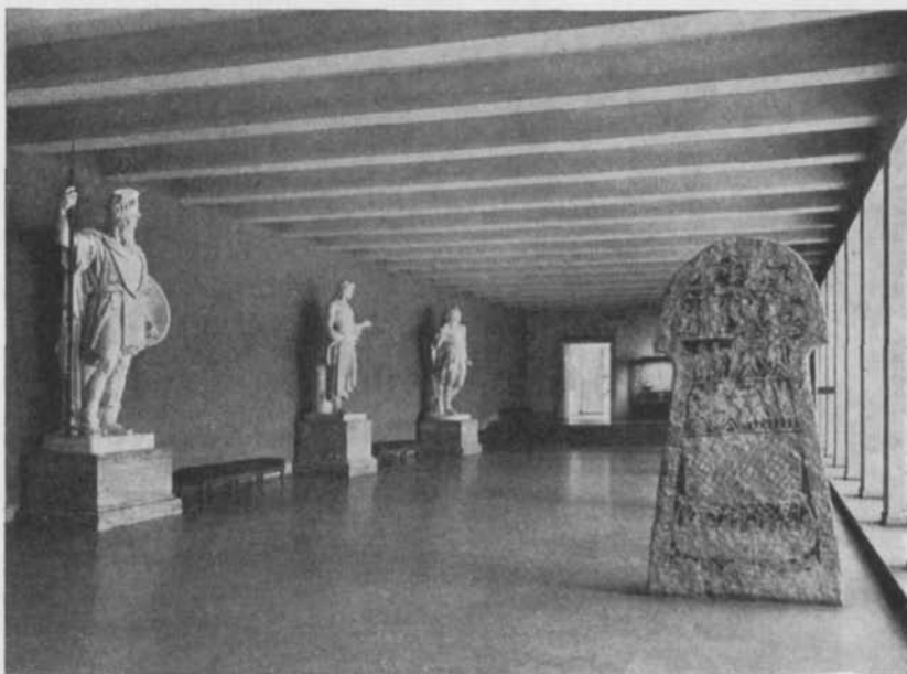
Fig. 1—2. Entréhallen i Statens historiska museum med avgjutningar av Rök-stenen och Piraeuslejonet (ovan) och med B. E. Fogelbergs gudar (nedan). — The Entrance Hall in the Museum of National Antiquities with the casts of the runic stone from Rök and the rune-inscribed lion from Piraeus (above) and with B. E. Fogelberg's marble statues of Odin, Balder and Thor (below).