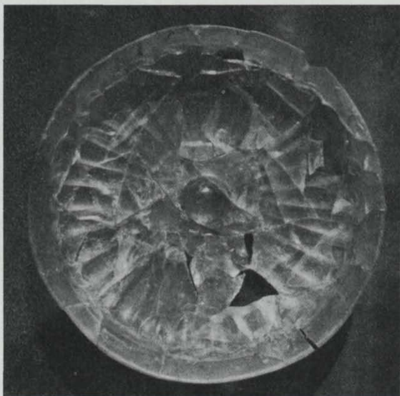
Fig. 1. Gordionskålen från insidan. Efter Journal of Glass Studies . — The inside of the Gordion bowl.

närmaste anförvanter, antagas på ett tidigt stadium ha kopierats i glas, ehuru sådana kopior ännu icke kommit i dagen.