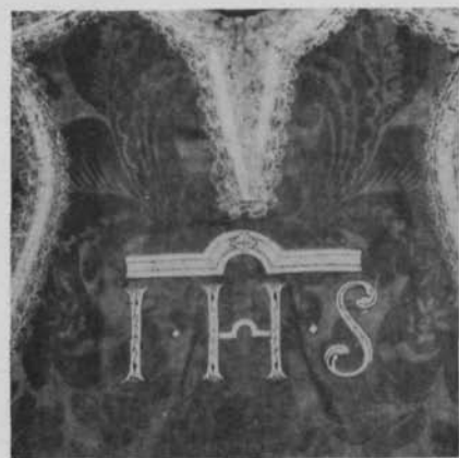
Fig. 2. Mässhake av gul sidendamast med reliefbroderi i guld och silke. a) ryggsidan b) framsidan. Skänkt 1731 av drottning Ulrika Eleonora till Flakebergs kyrka, Vg. — Chasuble of yellow silk damast with relief embroidery in gold and silk. (a) Back, (b) front. Presented by Queen Ulrika Eleonora to Flakeberg Church in 1731.