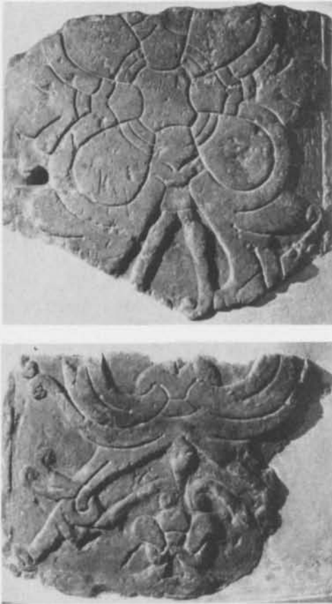
Fig. 2. Två fragment av gravsten från S:t Pauls kyrkogård, London. — Two fragments of grave-stone from St. Paul's Church-yard, London.

rial inte kan dateras tidigare än det insulära utan blir samtida eller rent av något senare än detta.