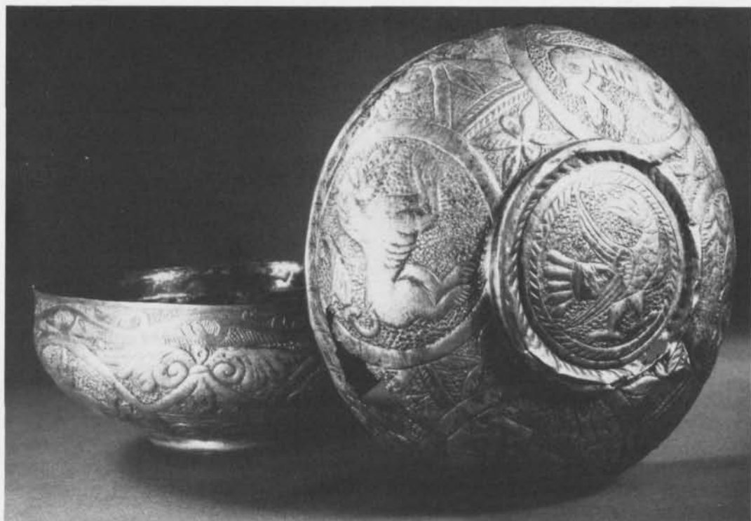
Fig. 8. Silverskålar från Älvkarleby. Hist. Mus. Stockholm. — Silver bowls from Älvkarleby. Mus. of Nat. Antiq. Stockholm.