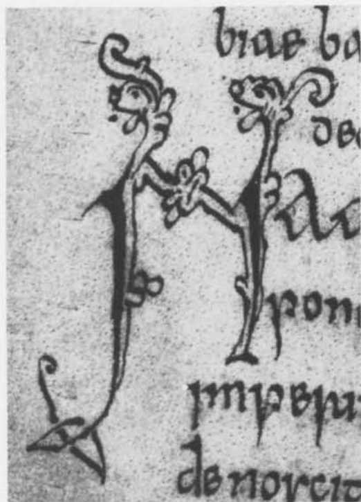
Fig. 1. Initialer med vegetabla och zoomorfa detaljer. MS. Royal 5 F III, British Museum, London. — Initials with vegetable and zoomorphic details.

Det som dock framför allt måste framhållas är, att hela kronologien för den yngre vikingatidens konststilar är i stöpsleven. För 900-talet har man bl. a. sökt urskilja en äldre och en yngre Jellingestil med namn efter monumenten i Jellinge på Jylland. I båda fallen har man dessutom sökt anknyta till historiska data för att därigenom uppnå fasthet i kronologien.