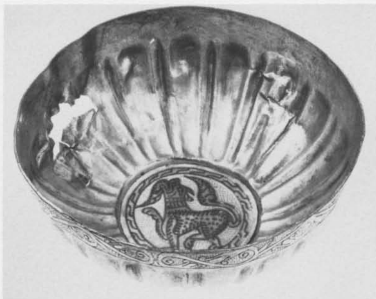
Fig. 7. Silverskål från Gamla Uppsala. Hist. Mus. Stockholm. — Silver bowl from Uppsala. Mus. of Nat. Antiq. Stockholm.