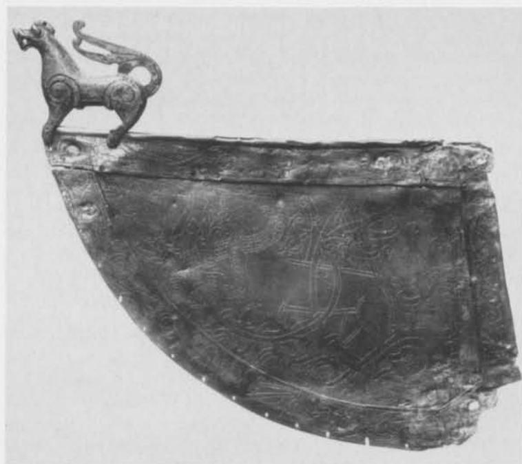
Fig. 6. Väderflöjel från Källunge kyrka, Gotland. — Weather vane from Källunge Church, Gotland.