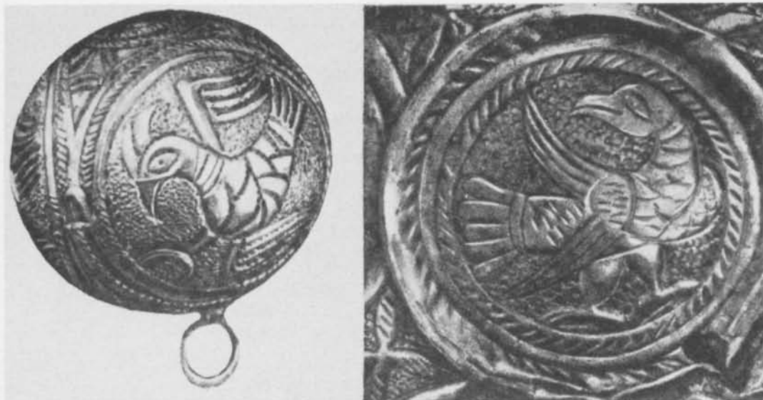
Fig. 9. Kulformigt silverhänge från Klepikino, Tjeckoslovakien samt bottenдекор till silverskål från Älvkarleby (efter Darkevič). — Ball-shaped silver pendant from Klepikino, Czechoslovakia, together with decoration on base of silver bowl from Älvkarleby.

västerländska konsten under 900-tal, 1000-tal och 1100-tal.