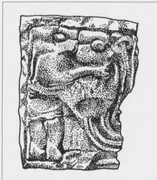
Fig. 3. Guldgubbens framsida. Teckning Anders Andersson, UV-Väst. —Gold foil figure, front.