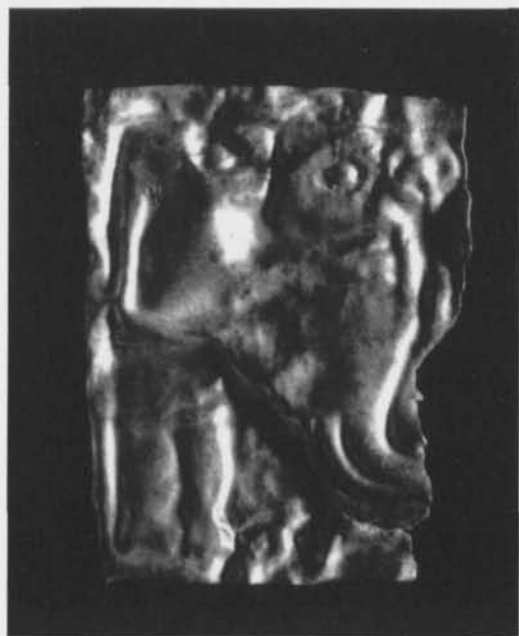
Fig. 1. Guldgubbens framsida. —Gold foil figure, front.