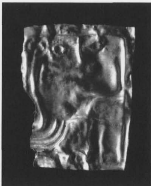
Fig. 2. Guldgubbens baksida. —Gold foil figure, reverse.