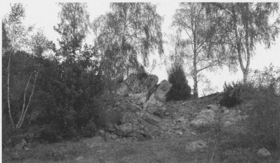
Fig. 1. Brebol, Lerbo sn, Södermanland. Centralt i bilden syns det bergsparti där ett antal yxor deponerats under tidigneolitikum. Foto förf. 2002. — Brebol, Lerbo parish, Södermanland. In the centre of the photograph is seen the rock outcrop where an axe hoard was hidden in the Early Neolithic.

skadats kraftigt genom att ett stort avslag slagits bort. Yxa C är av grå diabas och kan klassas som en spetsnackig yxa som är i det närmaste helslipad. Eggen har fått en kraftig skada varvid en omslipning av eggen påbörjats. Omslipningen har dock aldrig slutförts vilket gör eggen flat till utseendet. Yxa D är den enda som inte uppvisar spår av användning. Den är ett ämne, hugget helt om i grå diabas. F1 är ett diabasavslag som bland annat uppvisar bultmärken och negativa avspaltningssytor på dorsalsidan. Avslaget kommer från yxtillverkning, dock inte från någon av de påträffade yxorna. F2 är en grå diabasyxa, helslipad och tunnackig, som gått av på mitten. Endast nackhalvan av yxan påträffades. Dess ursprungliga längd kan uppskattas till 20–25 cm.