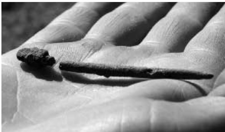
Fig. 2. Folkvandringstida dräktnål ur en stormskadad järnåldersdös. —Migration Period dress pin from a miniature dolmen.

ner intill den, varvid roten rivit upp hållarna som utgjort graven. Detta var inte den enda järnåldersdös som skadades av rotvältor under stormen Gudrun. I Odensjö socken i Kronobergs län (Raä 112) har Arkeologacentrum också undersökt en skadad järnåldersdös. Enligt uppgifter i FMIS hittade man där brända spädbarnsben och ett par bitar hartstättning. I Halland har Lennart Carlie (2006) lett undersökningar på ett gravfält i Södra Unnaryd socken där flera järnåldersdösar finns registrerade. Carlie grävde vid flera hållar, såväl solitära som parvis ställda. De parvis ställda hade i ett tidigare skede varit flankerade av en tredje (gavel-) håll, och sannolikt burit en takhäll.